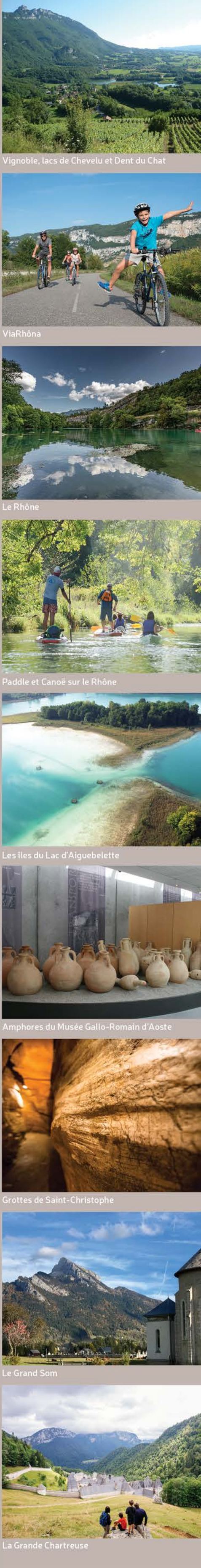
Vignoble, lacs de Chevelu et Dent du Chat