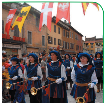
Fête médiévale à Yenne.

Un canal de dérivation de la Méline traverse la cité, apportant au bourg une source d'eau courante nécessaire aux usages domestiques et une force motrice qui permettait d'alimenter des moulins. Yenne a eu au siècle dernier des artisans tanneurs. Le canal de la Méline fournissait l'eau nécessaire au travail des peaux.