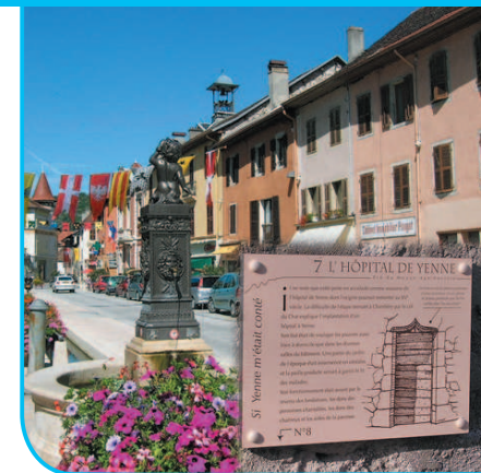
Place Charles Dullin