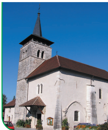
Eglise classée de Yenne.

Le Rhône, sur lequel la navigation était importante, venait lécher les maisons extérieures, tout près de l'église. Le clocher de l'église de Yenne présente les caractères indiscutables d'une tour fortifiée avec ses murs très épais et ses étroites ouvertures semblables à des meurtrières. Il veillait ainsi aux menaces provenant du fleuve. Par ailleurs la ville ne possédait aucun château comtal et sa sécurité dépendait des nombreuses maisons fortes qui forment un maillage très serré dans la campagne environnante.